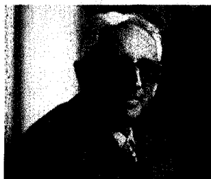
CRITICO Leonardo Benevolo

«Libeskind, Hadid, Isozaki fanno modesti progetti clone. Bravo Piano sull'ex Falck»